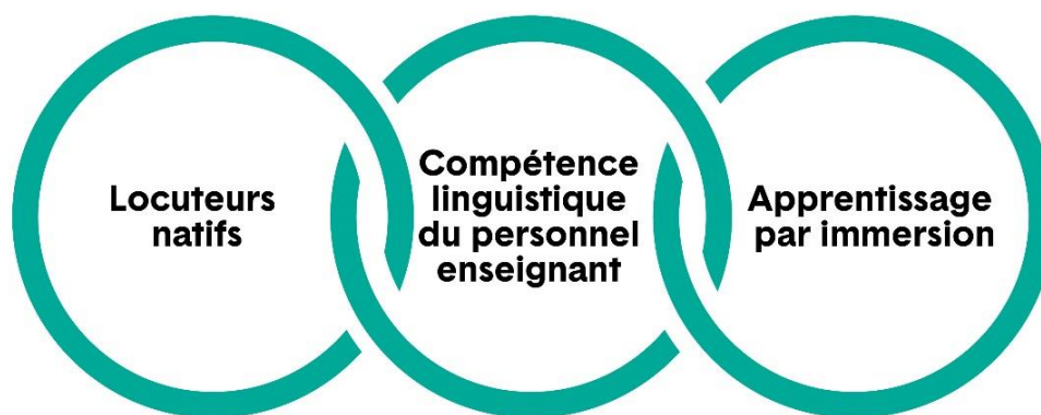
Figure 1 : Contexte important pour l'élaboration et la prestation du cours

La stabilisation de la perte linguistique pour rétablir les langues des Haudenosaunes, que ceux-ci croient avoir reçues du Créateur, est essentielle au maintien de leurs civilisations. Les valeurs et les connaissances culturelles des Haudenosaunes sont inhérentes aux langues, et l'haudenosaune y est profondément ancré, tout comme il l'est dans les territoires, les cérémonies, les pratiques culturelles et le mode de vie des Haudenosaunes, lesquels ont transcendé le colonialisme, y compris l'époque des pensionnats. Dans cette optique, les éléments suivants sont ajoutés comme points supplémentaires à considérer pour le développement et la prestation du cours menant à la qualification additionnelle Spécialiste en études supérieures en enseignement du tuscarora :