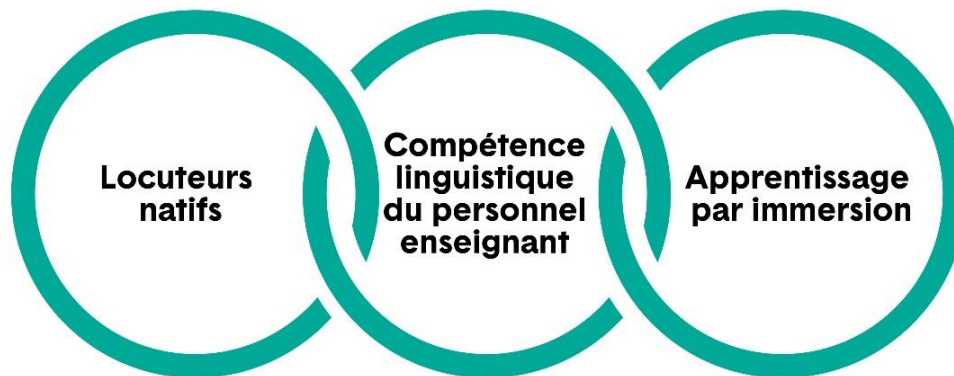
Figure 1 : Contexte important pour l'élaboration et la prestation du cours

La stabilisation de la perte linguistique pour rétablir les langues des Haudenosaunes, que ceux-ci croient avoir reçues du Créateur, est essentielle au maintien de leurs civilisations. Les valeurs et les connaissances culturelles des Haudenosaunes sont inhérentes aux langues, et l'haudenosaune y est profondément ancré, tout comme il l'est dans les territoires, les cérémonies, les pratiques culturelles et le mode de vie des Haudenosaunes, lesquels ont transcendé le colonialisme, y compris l'époque des pensionnats. Dans cette optique, les éléments suivants sont ajoutés comme points supplémentaires à considérer pour le développement et la prestation du cours menant à la qualification additionnelle Enseignement de l'onondaga :